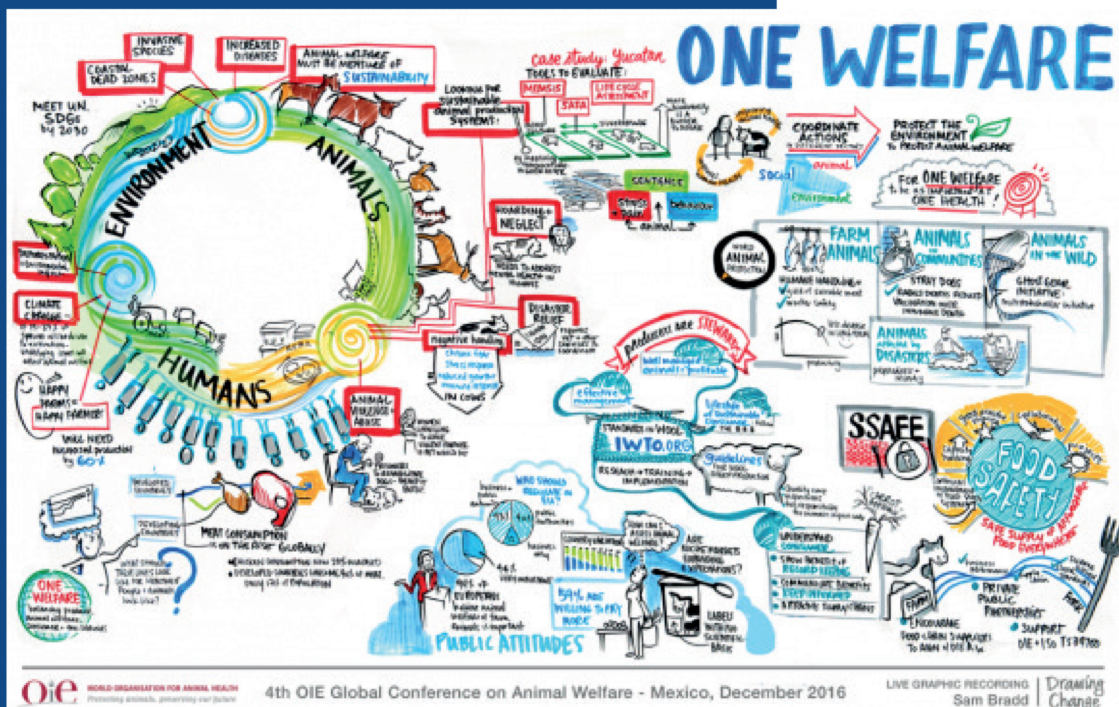
Figura 2: Interações entre bem-estar animal, humano e meio ambiente

Outra forma encontrada para demonstrar esta ampla ligação entre os sistemas humanos, animais e meio ambiental é por meio da Figura 2, que é o resultado de uma pintura realizada durante a 4ª Conferência Global de bem-estar animal da OIE ocorrida em Guadalajara no México em 2016. .