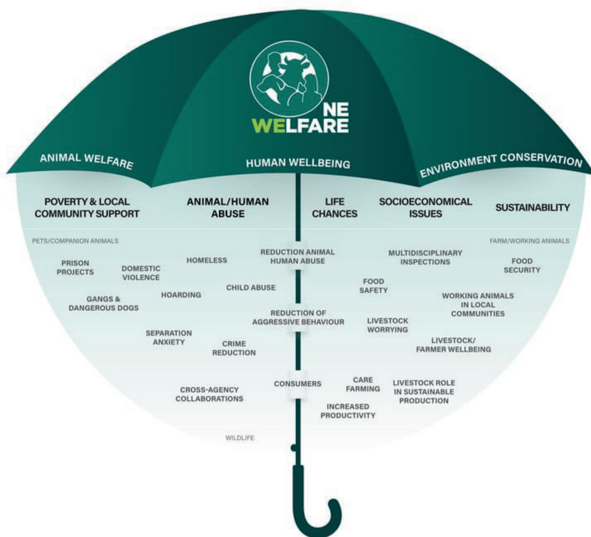
Figura 1: Abordagem do Um-Bem Estar demonstrando a conexão entre bem-estar animal, humano e meio ambiente. R. García Pinillos et al. Veterinary Record (2016)

Um bem-estar é um conceito que reconhece as conexões entre o bem-estar animal, o bem-estar humano e a integridade do meio ambiente.